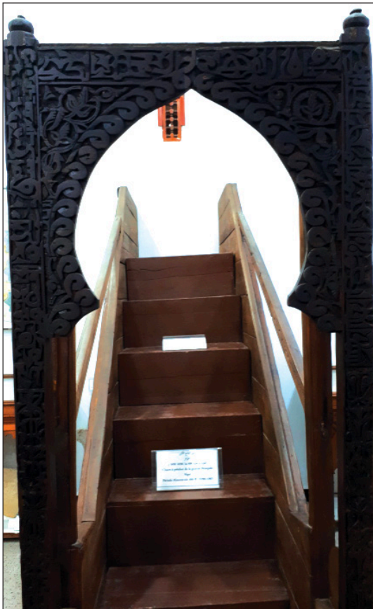
Fig. 4: Le minbar almoravide de la Grande mosquée d'Alger (490/1097), (Musée des Antiquités et arts islamiques, Alger).

Ashīr puis Alger entre 474/1081 et 490/1096. 42 L'inscription du minbar de la Grande Mosquée conservée dans le musée des Arts islamiques à Alger porte la date de 490/1097 attestant la dotation de cet édifice religieux d'un minbar au moment de la présence almoravide. 43 Cette date commémorant la fabrication du minbar ne peut pas constituer une preuve solide pour dater l'édifice, déjà antérieurement mentionné par les textes descriptifs. Cependant, il serait fort possible que la grande mosquée aurait été renouvelée pendant cette période même s'il est difficile de le confirmer avec certitude. L'attribution de la fondation de l'édifice aux Almoravides, par Rachid Bourouiba et d'autres archéologues, manque à mon avis d'arguments solides. Car ce même édifice porte une autre inscription commémorative montrant la construction du minaret en 723/1324 par l'émir ziyyānide Abū Tāshufīn. 44