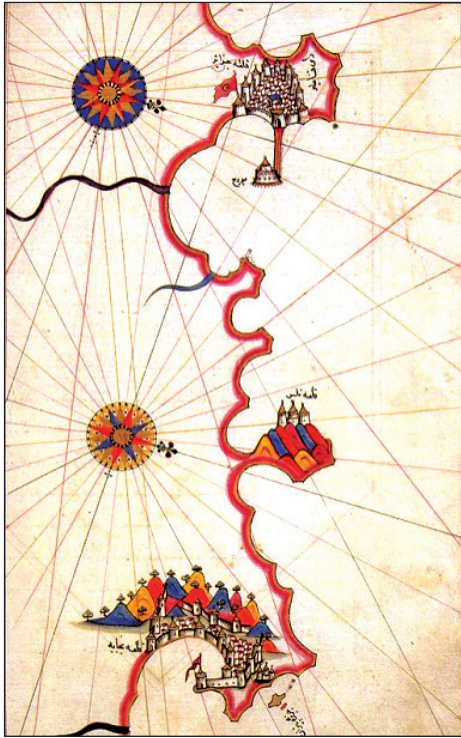
Fig. 5: Vignette d'Alger dans le Kitab-i Bahriye de Pīrī Reis composé par la première fois en 1521, Manuscrit de la Ayasofya Library du sultan Mahmud I (fac-similé, Istanbul, 1988, 3, p. 320, repris par http://annaba-patrimoine.com/ils-ont-parle-delle/peri-reis-1521 ).