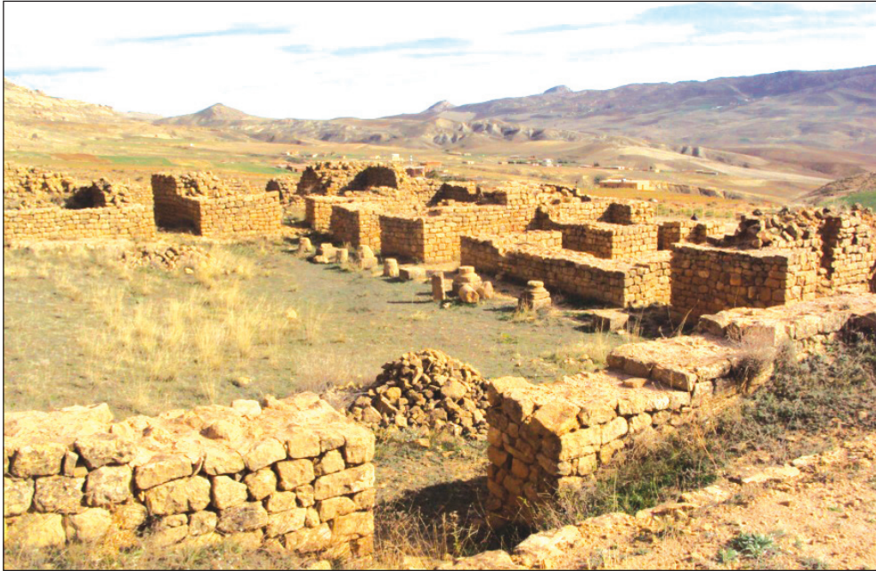
Fig. 1: Ashīr, berceau des Zirides, fondateurs de la ville d'Alger.

de l'Antiquité romaine. 12 Le toponyme pourrait se traduire littéralement par les "îlots des Banū Mazganna" (Maces), c'est-à-dire les quatre îlots, très voisins de la terre avant leur rattachement aux structures portuaires et défensives sous les Ottomans, 13 qui avaient donné leur nom à la ville. 14