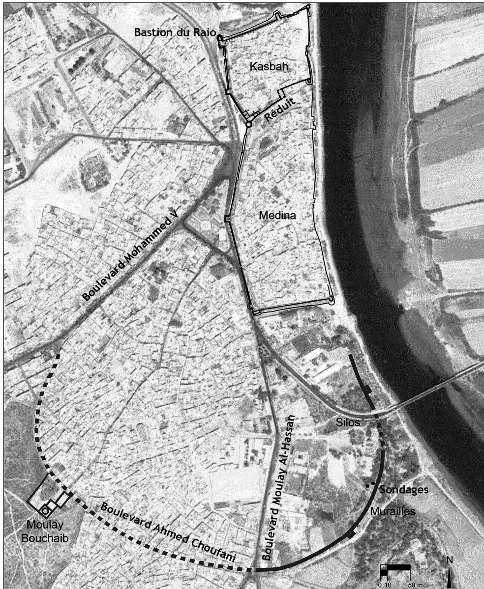
Fig. 7: En haut, l'enceinte de la médina d'Azemmour, d'origine mérinide et refaite par les portugais. En bas, l'enceinte médiévale plus ancienne, (ligne continue pour les vestiges relevés, ligne pointillée pour le tracé présumé).

Boulevard Ahmed Choufani, qui relie au mausolée de Moulay Bouchaib, le saint protecteur de la ville, pourrait coïncider avec le tracé de l'ancien dispositif de défense, qui aurait laissé une profonde marque dans le tissu urbain, (fig. 7). La courbure de cette artère, qui d'ailleurs continue au nord de cet espace religieux dans la Route Doukkala, semble indiquer un circuit tendanciellement circulaire, qui fermait ainsi au Moyen Âge cette partie de l'ancienne ville.