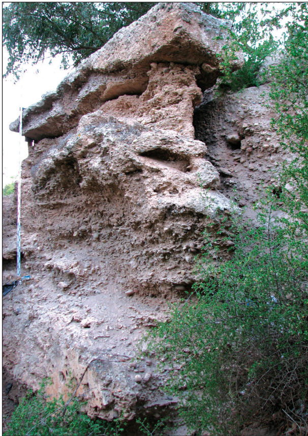
Fig. 9: Section de l'enceinte médiévale d'Azemmour, près du sondage archéologique. Remarquer que cette section de la fortification est composée de deux murs en pisé adossés, (© André Teixeira, 2010).