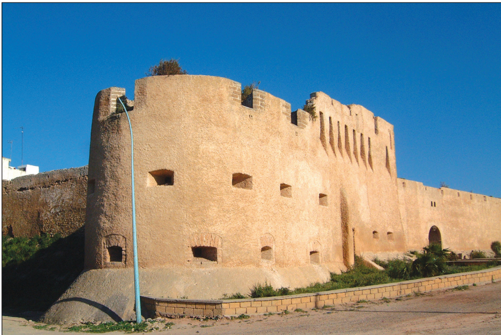
Fig. 12: Extérieur du bastion du Raio / Sidi Ouadoud dans le coin nord-ouest de l'enceinte de la médina d'Azemmour. Il est composé d'une partie quadrangulaire mérinide et l'extrémité arrondie de la période portugaise, avec une profusion de dispositifs de tir d'artillerie à différents niveaux. Les canonnières du sommet datent de la période saadienne ou alaouite, (© André Teixeira, 2005).

médiévaux. 73 Les travaux des Portugais se sont limités, donc, à l'augmentation de la structure précédente vers le nord, sur une plateforme arrondie qui permettait de flanquer les courtines, en plus de l'introduction de plusieurs dispositifs pour le tir d'artillerie, (fig. 12). Ainsi, les Portugais auront annulé beaucoup de tours préexistantes, choisissant d'en renforcer une partie afin de concentrer leur puissance de feu sur ce type de bastions à extrémité arrondie. Néanmoins, il faut remarquer que certains bastions sont le résultat de transformations saadiennes et alaouites, ou du moins leurs sommets ont subi des altérations à cette époque, de même que certaines tours carrées qui ont survécu.