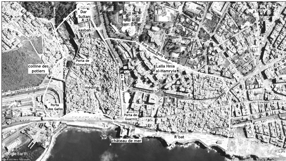
Fig. 3: La ville de Safi avec la proposition de tracé de l'enceinte médiévale. On peut voir aussi l'enceinte de l'actuelle médina, qui correspond aux murailles du réduit portugais, (Source: Google Earth).