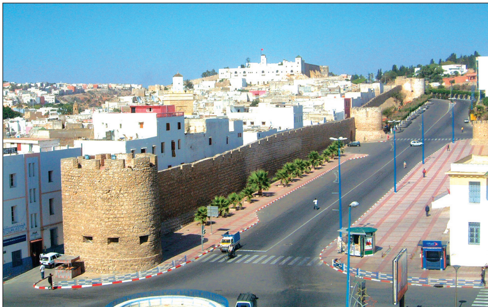
Fig. 6: Muraille du réduit sud de Safi d'origine portugaise au long de l'Avenue Moulay Youssef. Voir les bastions de plan ultra semi-circulaire avec des dispositifs pour le tir d'artillerie.

du fossé et l'implantation du talus ( alambor ) autour des nouvelles murailles du réduit, dotant ainsi les courtines d'une déclivité accentuée et rendant difficile leur échelonnement et leur démantèlement. 36