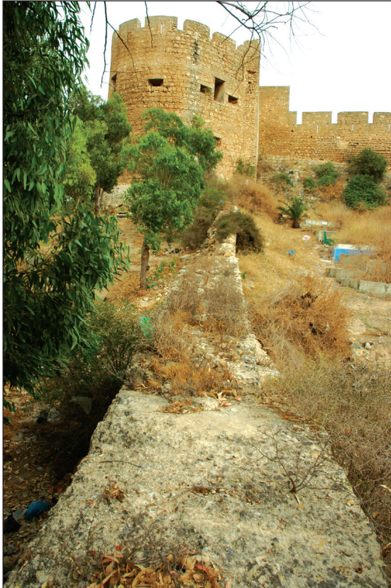
Fig. 5: Vestiges de l’enceinte médiévale de Safi entre la Rue des Forgerons et la tour ronde située plus au nord-est de la médina actuelle, (© Luís Serrão Gil, 2013).

voit également dans des photographies; 19 ici s’ouvrait la Bab al-Mdina ( porta de Almedina , dans les sources portugaises). 20 Traversant le fleuve, la muraille s’élèverait vers l’actuelle colline des potiers, en comprenant éventuellement la tour en pisé quadrangulaire conservée (Bordj el Kouass), mais en suivant un chemin impossible à reconstituer; elle s’achevait sur une sorte de brise-lames ( couraça ) qui existait au bord de la mer, fermant ainsi la plage au nord-ouest de l’enceinte, s’ouvrant dans ses environs la porte des lépreux ( porta dos Gafos , dans la documentation portugaise).