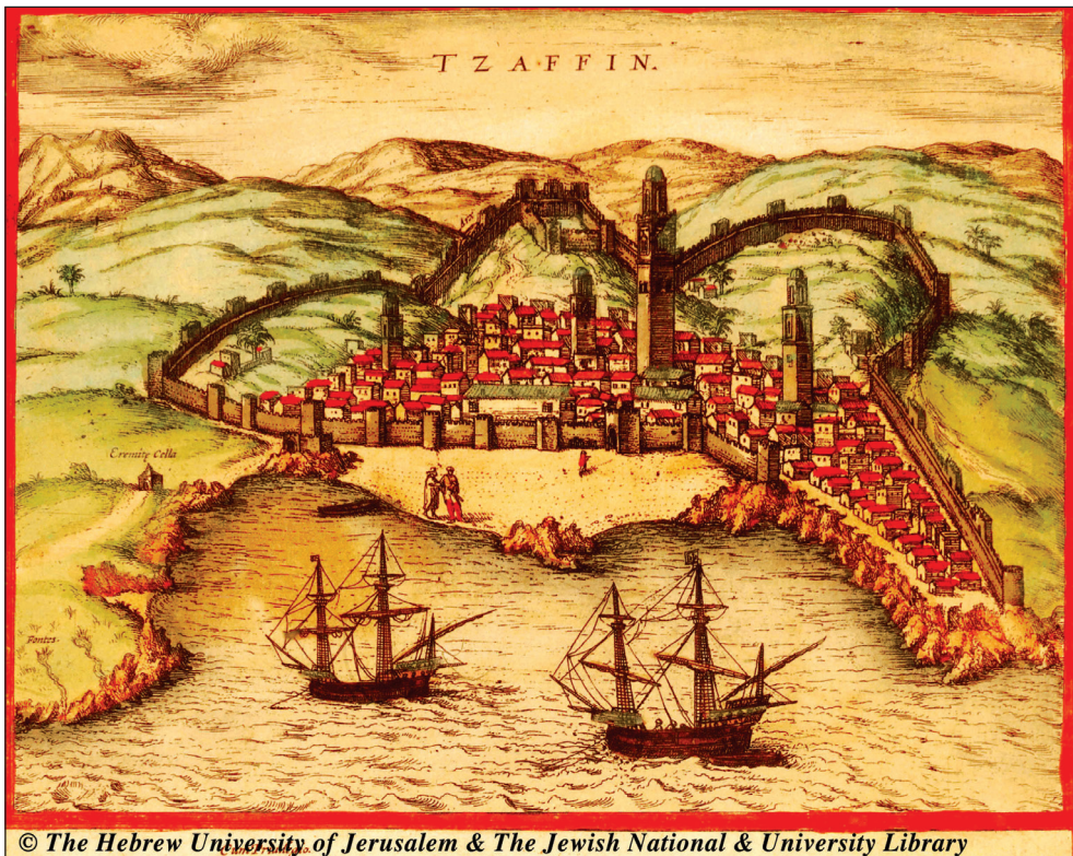
Fig. 1: Safi au début du XVI ème siècle, (Source: Georgius Braunius, Franciscus Hogenbergius, Civitates , vol. I, 56v).

Le périmètre fortifié avait 1193 braças , correspondant à 2624,6 m, et était protégé par 75 tours. 11 La ville était divisée en deux enceintes fortifiées. D'un côté la kasbah, espace fortifié typique de l'élite politico-militaire, implanté dans la zone la plus élevée à l'est, sans maisons et avec un accès direct vers l'extérieur. De l'autre côté la médina, la partie essentielle du noyau urbain, y compris la zone basse en bord de mer et à mi-côte; elle était limitée par deux murailles qui descendaient de la kasbah vers la mer, côté sud et nord, et par une muraille à l'ouest qui protégeait la plage, la falaise n'ayant aucune fortification, (fig. 1).