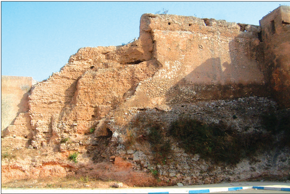
Fig. 11: Courtine nord de l'enceinte de la médina d'Azemmour. La muraille en pisé mérinide est visible sous la face et le talus en maçonnerie de pierre portugais, (© André Teixeira, 2005).

Outre les travaux sur la muraille du château, on fait mention de la construction de quatre bastions, dont deux sont détachés, ceux de São Cristóvão et du Raio, considérés comme étant les éléments les plus robustes du système défensif, 69 dans une description détaillée de ce dernier. 70 Les bastions sont préservés aujourd'hui (fig. 12), étant interprétés comme des "réalisations de meilleure qualité que nous a légué l'époque de D. Manuel", des formes les plus évoluées de l'architecture militaire de transition dans le contexte portugais, en raison de son degré d'adaptation aux nouveaux défis militaires de l'artillerie. 71 Ces bastions étaient de véritables modèles "du langage architectural le plus avant-gardiste, en permettant l'utilisation des armes plus modernes," par la profusion de dispositifs de tir d'artillerie à différents niveaux. 72