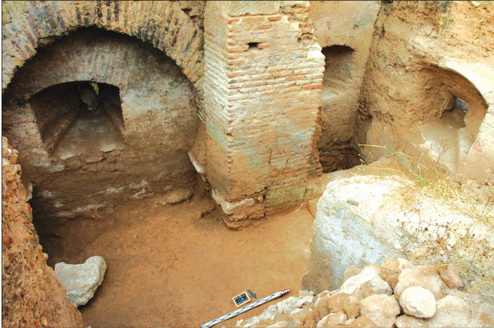
Fig. 13: Fouilles archéologiques à l'intérieur du bastion du Raio/Sidi Ouadoud de l'enceinte de la médina d'Azemmour. À droite un arc outrepassé, à gauche canonnières creusées dans le mur en pisé pendant la période portugaise, (© André Teixeira, 2011).

associaient une maison forte à un donjon, il s'écarte de ce modèle par sa courte hauteur et sa grande épaisseur; on estime que cette construction pouvait recevoir des armes à feu. 76 Les détails des ouvertures et des façades reflètent l'esthétique du roi Manuel I er , le nouveau seigneur de la ville, 77 montrant encore comment cet aspect de la propagande a été développé par les Portugais.