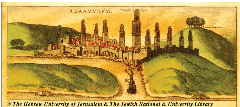
Fig. 10: Azemmour au début do XVI ème siècle.

La seule référence qui cadre avec ces découvertes archéologiques est le texte de Jean Darlet, publié sans indication de la source historique primaire, qui relate qu’en 1434 “les habitants qui ne pouvaient plus vivre dans cette agglomération l’abandonnent et reconstruisent leur ville là où elle est actuellement” et que le sultan “fit édifier en 1451 trois mosquées et envoya dans la cité des fqihis et des oulémas. Dix ans plus tard il faisait fortifier la ville.” 52 Ce passage énigmatique présuppose les raisons, pour l’instant inconnues, qui ont poussé les habitants d’Azemmour à déplacer ou à réduire la ville ancienne, avec la construction des nouvelles murailles.