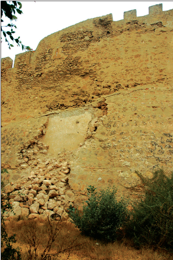
Fig. 4: Courtine de la muraille de la médina de Safi dans l'Avenue Moulay Youssef près de l'intersection avec la Rue Ibnou Badis. Sous le talus portugais sont visibles des vestiges de l'enceinte médiévale en pisé, (© Luís Serrão Gil, 2013).

Salih, 17 qui se trouverait à proximité. On signale l'identification dans cette zone, le long de la voie ferrée, des vestiges de silos médiévaux ainsi que des structures et du mobilier archéologique des XIII ème -XV ème siècles dans le château de mer (dans nos travaux inédits), prouvant que cet espace méridional de la ville était occupé avant l'arrivée des Portugais, comme en témoigne la représentation du XVI ème siècle, (fig. 1).