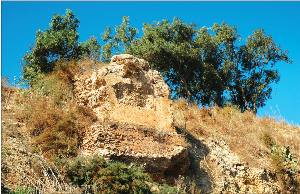
Fig. 8: Tour de l'enceinte médiévale d'Azemmour face à l'oued Oum er-Rbia, (© André Teixeira, 2009).