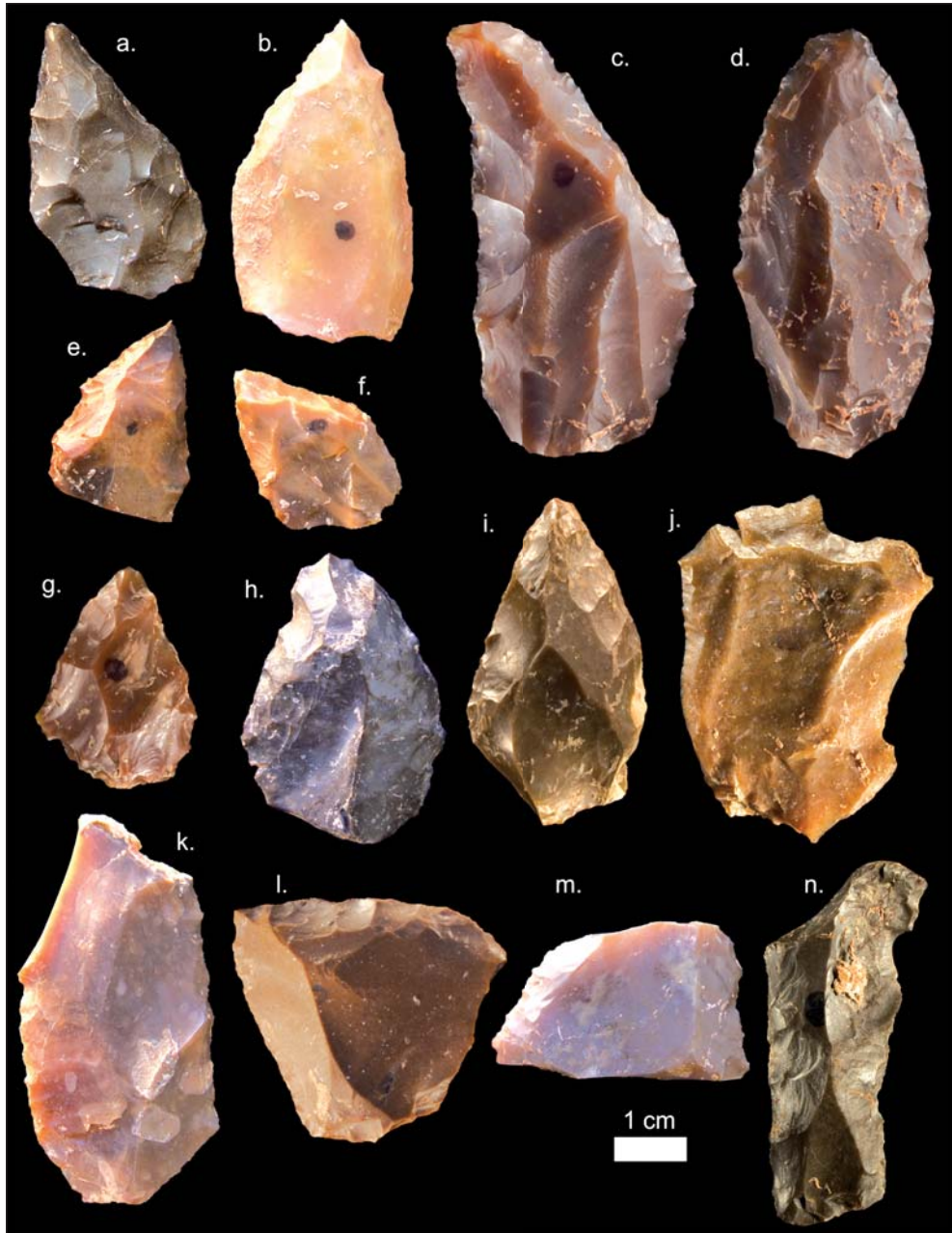
Figure 6: Assemblage lithique (MSA).