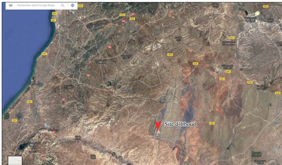
Figure 2: Situation géographique du site d'Irhoud