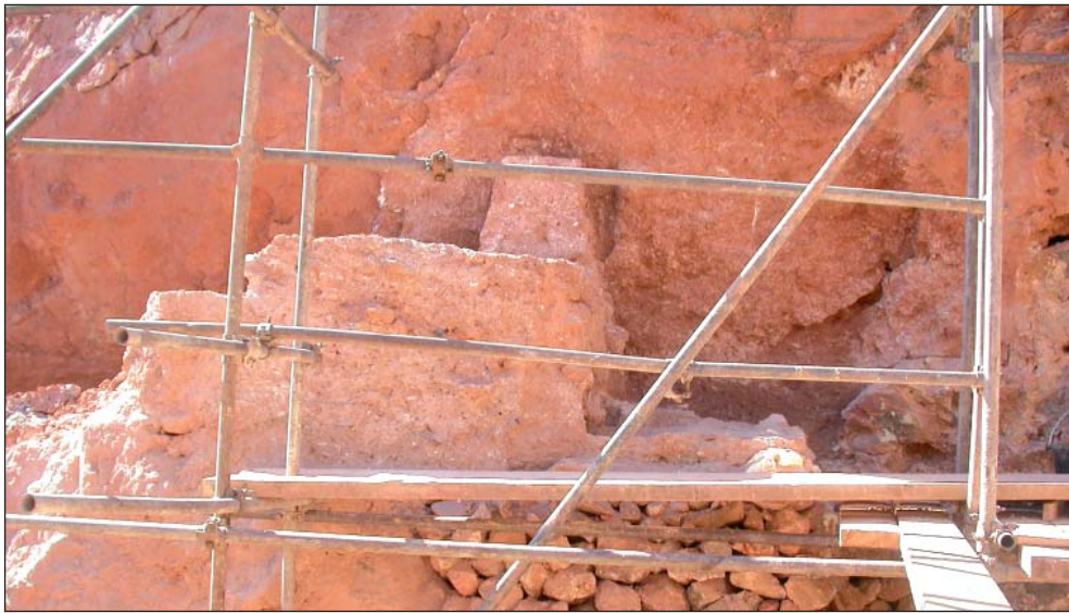
Figure 1: Site de Jbel Irhoud