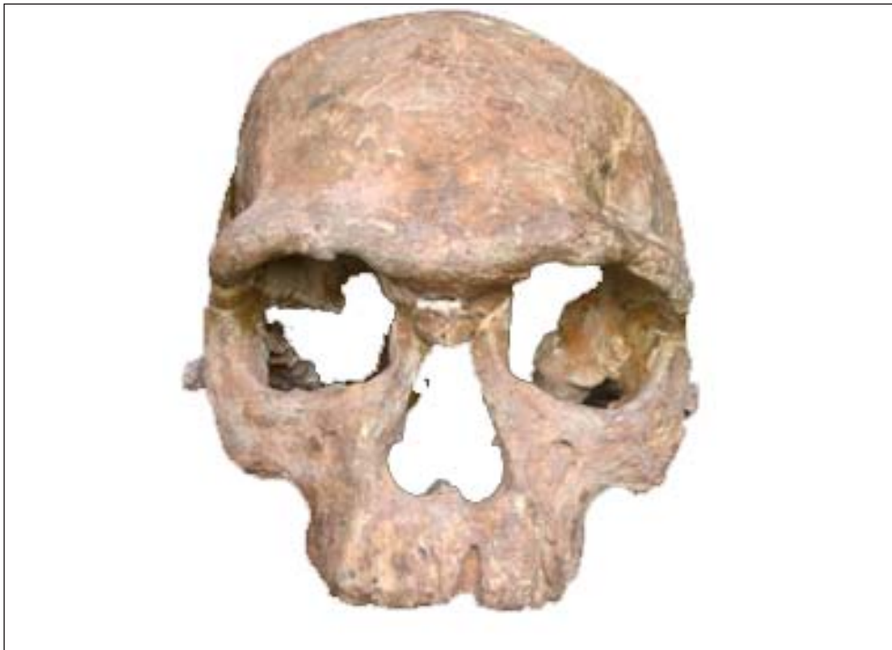
Figure 3: Crâne Irhoud 1 face

En 1961, la découverte fortuite dans ce massif, d'un crâne humain fossile (fig. 3: crâne 1), 3 à l'occasion du creusement d'une galerie de mine, y a révélé un site paléolithique majeur.