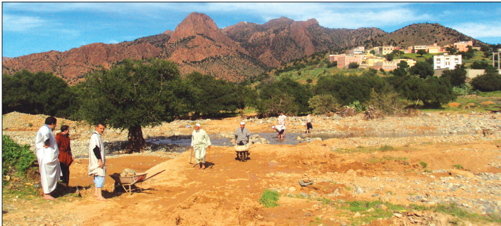
Fig. 5: [Villageois participant à la tiwizi : aménagement d'un chemin et d'un gué. Anti-Atlas, province de Tiznit].

Le botaniste britannique Joseph Dalton Hooker a exploré le Haut Atlas occidental en 1871, où il a constaté que les routes présentaient des lacets soigneusement aménagés le long de versants très pentus, (fig. 4). Ces courbes artificielles permettaient d'atténuer la forte inclinaison naturelle du terrain et facilitaient le passage des voyageurs et des animaux de charge. 38 Accrochées aux flancs de la montagne, les voies de communication étaient régulièrement entretenues pour résister aux divers agents de destruction: vents violents, neiges en hiver, fortes averses même en été... 39 Les travaux d'entretiens étaient en général réalisés par les habitants dans le cadre d'une ancienne pratique d'entraide communautaire dite: " tiwizi ," (fig. 5). 40