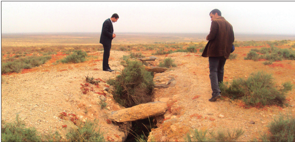
Fig. 6: [Vestiges d’une citerne ( tanutfi ) de bord de route. Province de Tiznit].

Riche en ressources hydriques, le Haut Atlas occidental offre aux voyageurs la possibilité de s’approvisionner en eau pendant une grande partie de l’année. Mais, il arrive souvent que le trajet des routes traverse des zones situées à l’écart des sources émergentes ou de puits. Pour remédier à ce problème, des citernes, dites localement tanutfi , étaient aménagées pour récupérer l’eau de pluie et fournir ce précieux liquide surtout en saison chaude. Construits généralement par les habitants comme acte de piété, ces réservoirs souterrains enduits à la chaux, sont répartis le long des tabrida -s en provenance du l’Anti-Atlas et qui franchissent le Haut Atlas occidental en direction du nord, (fig. 6). 41