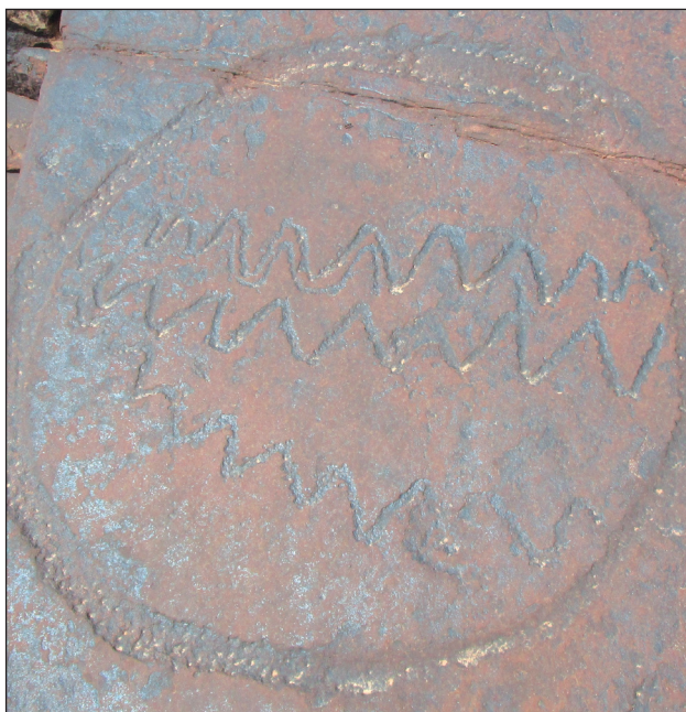
Fig. 2: [Détail d'une gravure rupestre de tizi n tirghist: cercle orné de motifs en zigzag. (province d'Azilal, Haut Atlas central)].