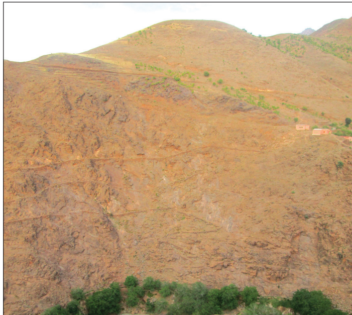
Fig. 4: [Réseau de chemins muletiers en lacets aménagés sur une pente abrupte. Tribu Idaw Maḥmud, versant nord du Haut Atlas occidental, province de Taroudant, (© A. Amarir)].

D'un point de vue grammatical, la morphologie de tabrida reflète une forme ancienne des parlers amazighs du Maroc; dans les dialectes actuels, le féminin singulier est marqué, en règle générale, par deux t l'un initial et l'autre final, tandis que le mot tabrida se termine par le suffixe a . En effet, et comme l'a expliqué George Marcy, ce suffixe est résiduel de genre dans un grand nombre de noms féminins: tafedna , "chaudron," tasa , "foie," takerza , "labourage," ainsi que tabrida , "chemin." 33 Un document latin connu sous le nom de "Géographie de Ravenne" cite la forme masculine de ce terme, à savoir, Abrida pour désigner une région au nord du Maroc. 34 Au XI ème siècle Abū 'Ubayd 'Abd Allāh al-Bakrī, utilise tabrida dans sa description de la route qui reliait Oujda à Fez. 35 Au siècle suivant, le géographe al-Idrīsī mentionne à son tour tabrida en parlant de celle qui menait de Fès à Tlemcen (et qui se confond évidemment avec la précédente sur une partie de son tracé). 36 Cet ancien terme était associé aux grands axes de transit dans l'histoire du Maroc tout entier, et il est encore présent dans la toponymie du Haut Atlas occidental et garde ainsi le souvenir des voies majeures qui permettaient de traverser cette chaîne de montagne depuis des temps immémoriaux.