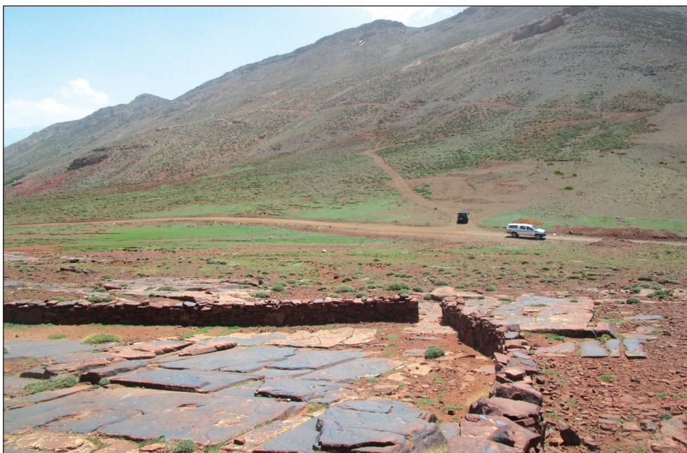
Fig. 1: [Tizi n tirghist (province d'Azilal, Haut Atlas central). Au premier plan, les dalles horizontales portant les gravures rupestres sont entourées d'un muret de pierre sèche récent].